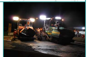
Mise en œuvre du tapis terminée