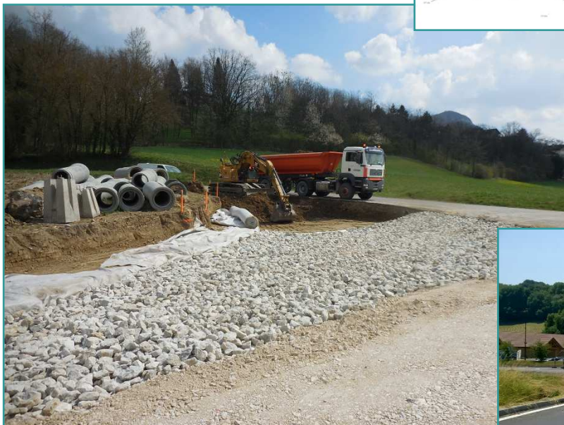
Travaux de cloutage sur les extensions de la Route Départementale